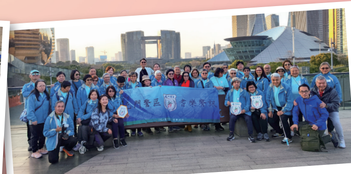
於杭州日月同輝合照