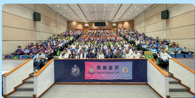
22區耆樂警訊會員於耆樂理財長門人訓練中大合照

於三月二十五日我參與了於警察學院舉行的「耆樂理財防騙長門人訓練課程」，課程中讓我與其他會員知悉許多最新的科技罪案及騙案案例，亦提醒我們在網上購物或投資時要時常警惕，高級警司林詩韻的開場白：「縱使今天不是袋錢入你們的袋，也能防止你們的金錢被騙走」令我印象尤其深刻。最後共有189位會員成功通過考核成為「耆樂理財防騙長門人」，將來可幫手向親友鄰舍宣傳防騙訊息。