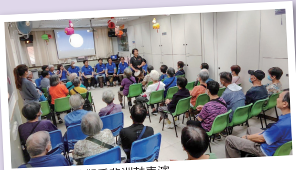
長者們留心地觀看非洲鼓表演