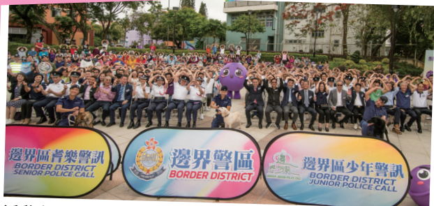
活動由數百名長官、嘉賓、耆樂警訊及少年警訊會員參與

當然，嘉年華還有一系列精彩的表演及活動，包括沙頭角地區特色的魚燈舞和陸上龍舟舞、邊界區少年警訊及元朗區耆樂警訊的防騙話劇、大埔區少年警訊的提子舞、新界北衝鋒隊及警犬隊表演。現場還展示了劍齒虎裝甲車，反詐騙協調中心宣傳車以及不同部隊的裝備，亦設有攤位遊戲，讓來賓及市民在輕鬆愉快的氛圍中掌握防騙知識，參與的市民更有提子紀念品，務求令大家將防騙訊息帶到社區及家庭中。