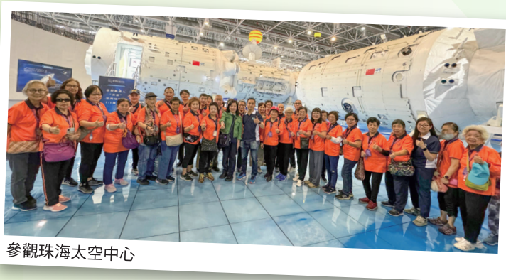
參觀珠海太空中心

我參加了兩日一夜的珠海科技文化交流團，期間在珠海市實驗中學與當地學生和老師交流兩地文化，之後遊覽了長隆海洋王國、參觀了珠海金灣藝術中心及太空中心。交流團讓我體會到祖國在科技、藝術、教育及旅遊方面的高速進步，身為中國人非常自豪。