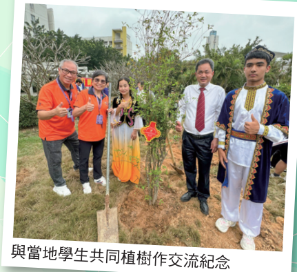
與當地學生共同植樹作交流紀念