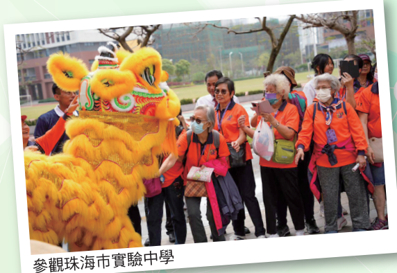
參觀珠海市實驗中學