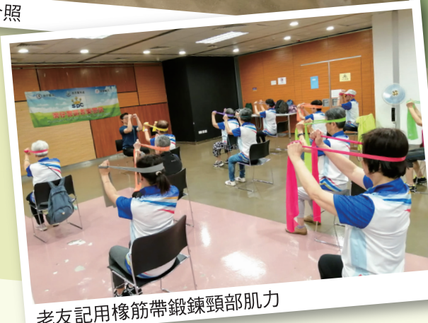
老友記用橡筋帶鍛鍊頸部肌力