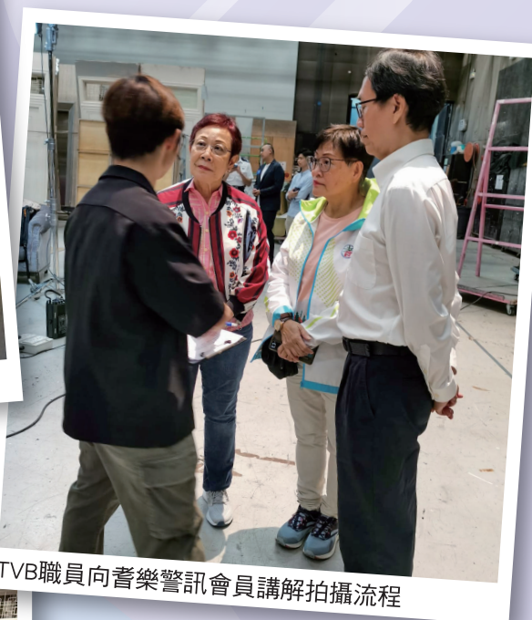
TVB職員向耆樂警訊會員講解拍攝流程