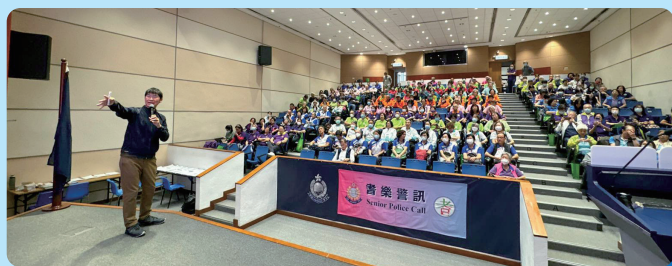
投資者及理財教育委員會代表向會員分享審慎理財知識