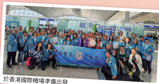
於香港國際機場準備出發