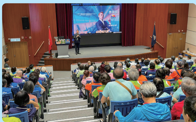
網絡安全及科技罪案調查科向會員講解網絡陷阱