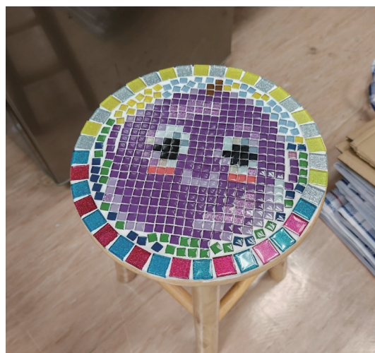
以「提防騙子」為題打造出「提子凳」