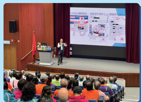
反詐騙協調中心同事向會員介紹「最新騙案手法」