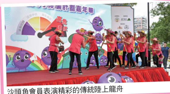
沙頭角會員表演精彩的傳統陸上龍舟

嘉年華由警察銀樂隊的美妙音樂揭開序幕，主禮嘉賓用油掃在螢幕上掃出美麗的提子壁畫。邊界警區指揮官劉經倫總警司為邊界區耆樂警訊會員頒發「提子隊長」的委任狀，感謝會員多年來為邊界警區宣傳防騙作出的努力，希望未來「提子隊長」繼續向身邊的親友宣傳防騙訊息，提高社區的防騙警覺性。