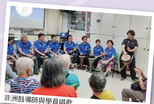
非洲鼓導師與學員唱歌