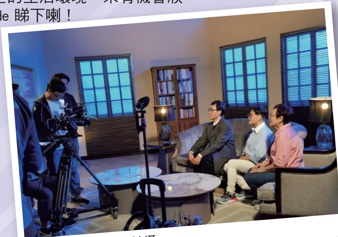
耆樂警訊會員準備拍攝