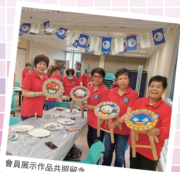
會員展示作品共照留念