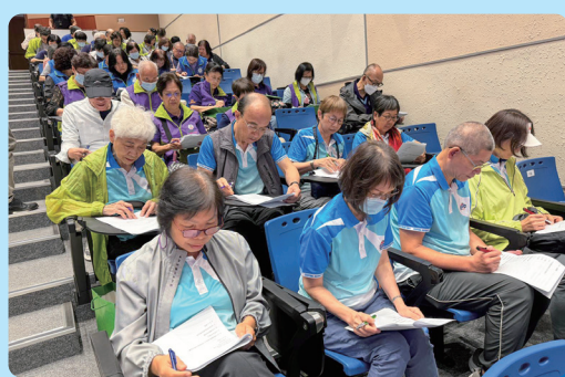
會員進行耆樂理財防長門人考核