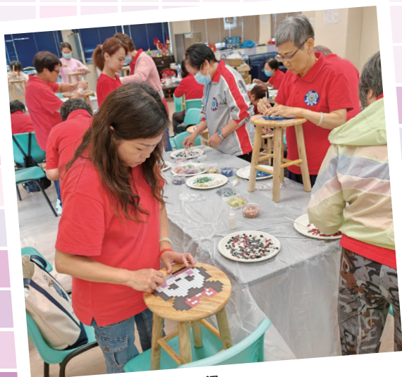
會員專心製作凳子過程

整個工作坊過程充滿歡樂和意義，當中一名會員更靈機一觸，以「提防騙子」為主題打造出了一張獨一無二的防騙「提子凳」，希望藉此提醒自己和家人需時刻保持警覺以提防騙子。