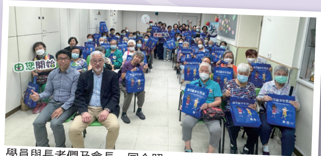
學員與長者們及會長一同合照

我有幸參加了非洲鼓音樂班，經過導師的悉心教導後，我與其他學員更有機會到鄰舍活動中心向老友記表演非洲鼓，並協助他們安裝和使用最新的「防騙視伏App」及介紹騙徒最新的行騙手法。老友記積極的態度令我感到參加耆樂警訊非常有意義，發揮助己助人的精神。