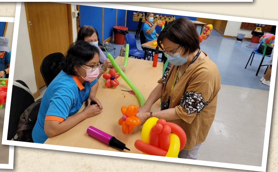
中區耆樂警訊會員學習製作氣球花賀母親節