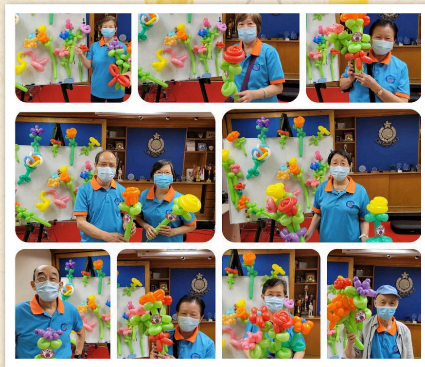
各位學員都成功製作出獨一無二的作品

這次活動的導師是由會員們擔任。活動當天，他們一早佈置好場地，還提前準備了很多不同款式的氣球花作展示之用，十分用心。會員們到場後，紛紛讚美導師們的作品，急不及待地想學習如何製作氣球花。導師們悉心講述及示範每個步驟，將自己在外所學到的知識及技藝分享，會員們十分留心並成功製作出自己的作品，導師與會員們都樂也融融。