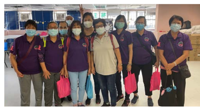
老友記認為防騙講座內容實用有趣