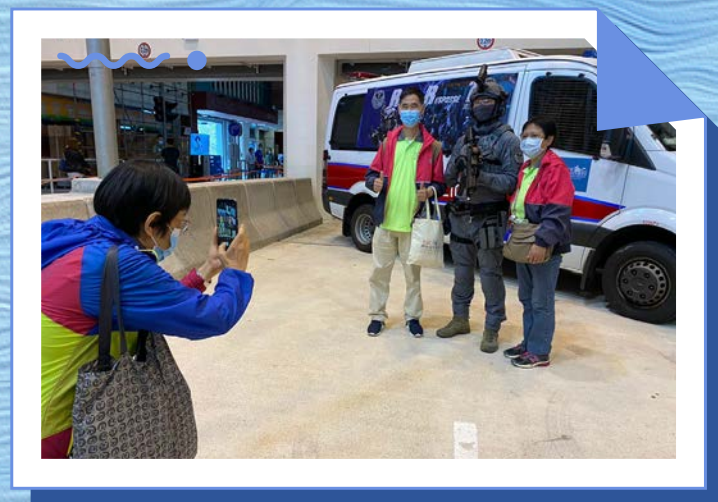
各耆樂警訊會員均滿意今次的參觀之旅，並對警隊的裝備甚感興趣