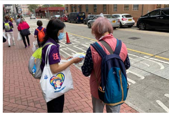
老友記到煙廠街一帶派發防騙宣傳單張及記念品

「防騙月」的第一浪活動包括三場防騙講座，共吸引了近 80 名旺角區耆樂警訊老友記參與。除了有旺角警區警民關係組人員向旺角區耆樂警訊會員傳遞防騙資訊，更加邀請到西九龍防止罪案辦公室人員講解現時最新罪案趨勢及個案分享，並播放內容有趣豐富的防騙宣傳短片。一眾老友記都反應熱烈和積極發問，並緊記防騙三寶：收線、核實、搵求助，以免誤墮騙徒陷阱。