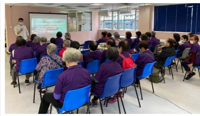
旺角警區警民關係組人員在會所向老友記傳遞防騙資訊