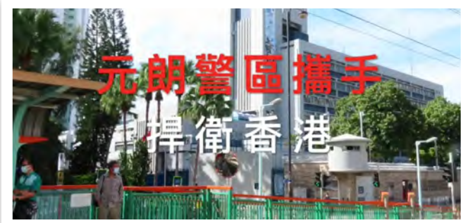
音樂短片節錄片段

短片由 2021 年初上載至今反應良好，網上點擊率接近 1500 次。我們期待「捍衛香港」的歌聲響遍香港的每一角落，讓我們一同支持警隊、愛護及捍衛香港！