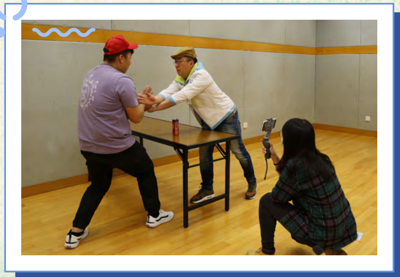
耆樂警訊為最佳效果傾力演出