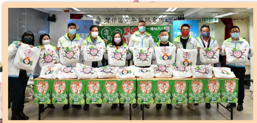
耆樂警訊祝願各位長者新一年過得豐足、幸福。