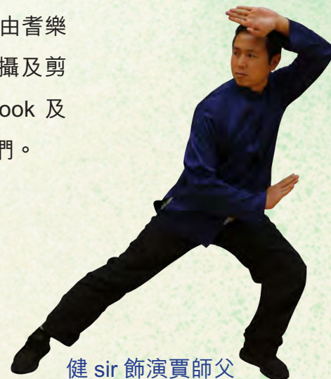
健 sir 飾演賈師父

耆樂警訊早前在社交媒體推出「郁多啲系列」運動短片，讓各位老友記留家抗疫期間都可以強身健體，增強免疫力。短片叫好叫座，耆樂警訊決定「添食」，拍攝新一輯「郁多啲系列」短片，邀請蛇鶴詠春陳師父教大家 13 式詠春基本動作，達到養生及協調肌肉平衡的效果，更加切合各會員的需要。