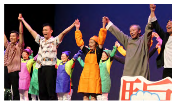
音樂短片剪輯了元朗耆樂名譽會長會過往的服務點滴片段