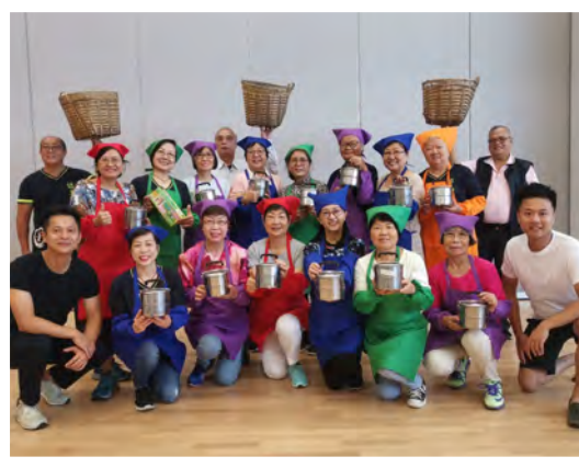
整個音樂短片拍攝過程獲各年齡層的市民參與 參演者以工廠妹造型演出