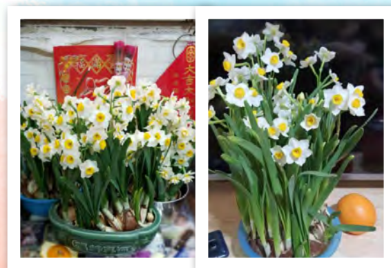
會員跟從剝水仙花頭凡技巧，成功在新年前培植出燦爛的水仙花。