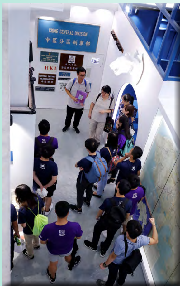
耆樂警訊導賞員向學員講解相關歷史背景及事跡。