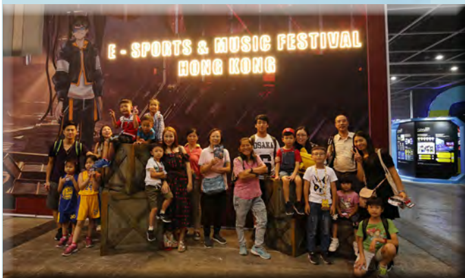
少年警訊會員與耆樂警訊會員於香港電競音樂節內感受電子競技氣氛。