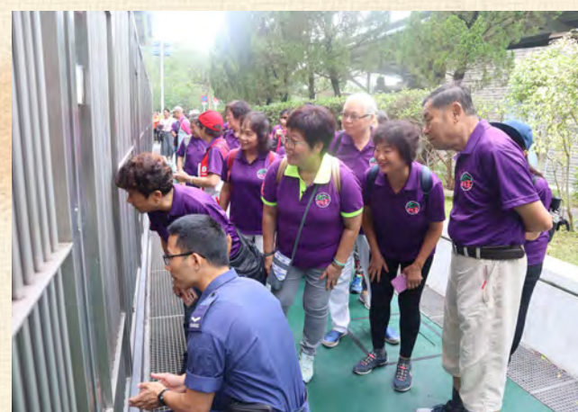
於警犬訓練基地籠舍探訪警犬並了解警犬隊日常的照顧工作。