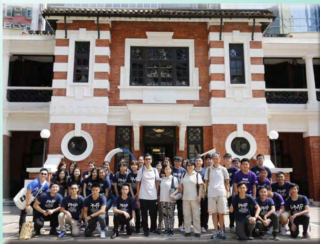
耆樂警訊導賞員帶領「警隊學長計劃」學員參觀「大館 101」專題展覽。