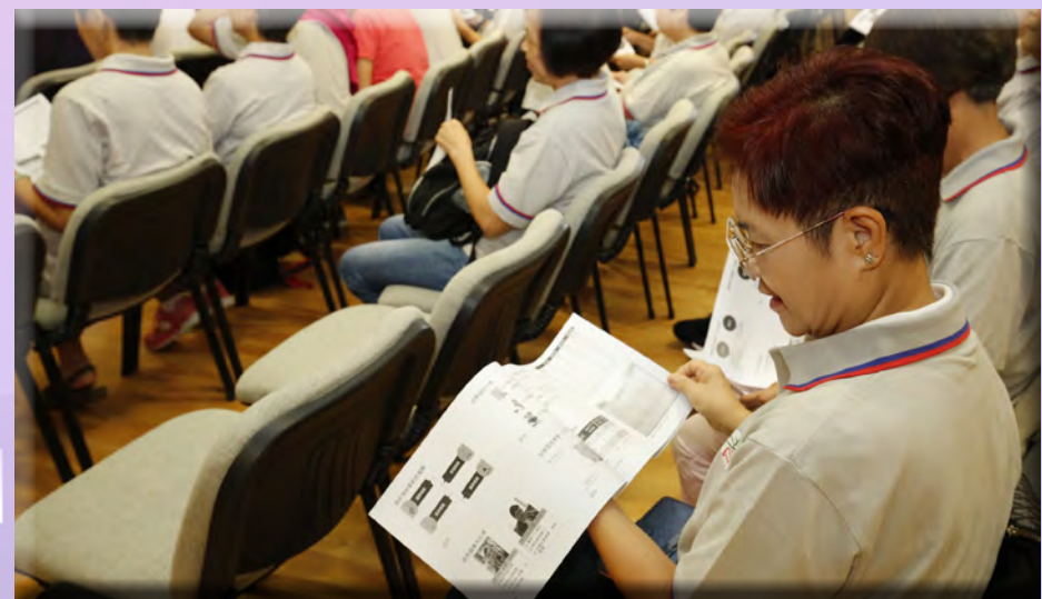
會員認真閱讀及了解課程內容。