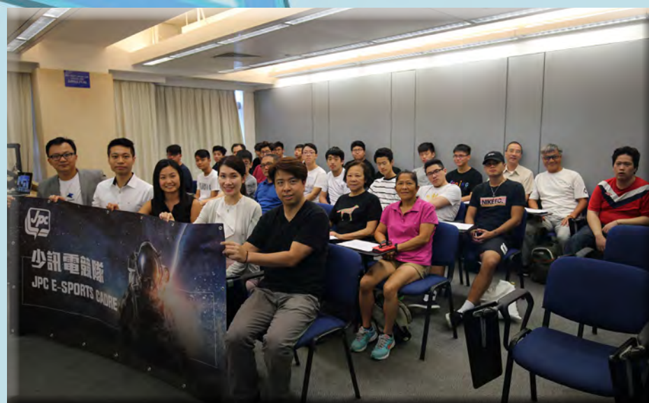
少年警訊會員與耆樂警訊會員於首日課程中合照。