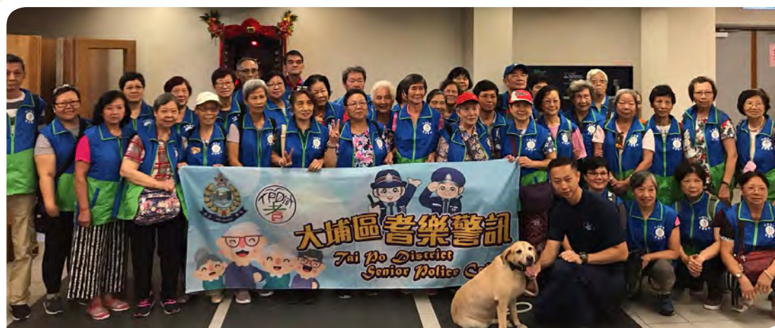
大埔區耆樂警訊與警犬及警犬隊人員合照。

整個參觀活動透過警犬隊的工作，加深會員對警犬隊的認識，並了解警犬隊不同的工作範疇，愉快地渡過一個快樂的早上。