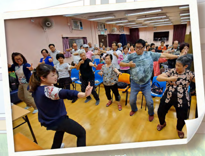
講者與老友記一齊做八段錦健身氣功。