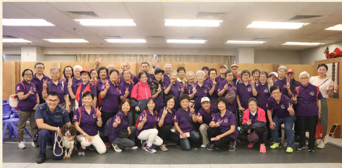
旺角區耆樂警訊會員於警犬訓練基地合照。

旺角警區警民關係組人員於5月29日，帶領四十多名旺角區耆樂警訊會員參觀警犬訓練基地。警犬隊同事向會員詳細講解警犬隊不同的工作範疇，加強會員對部門的運作及警犬訓練的了解。期間更讓會員參觀犬舍及佩帶犬隻訓練裝備。最令會員興奮的環節就是能「零距離」接觸警犬。各會員對是次活動都讚口不絕，留下深刻印象。