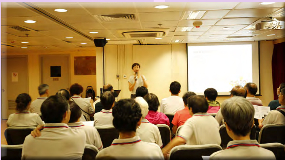
會員在專心聆聽講師的課程。