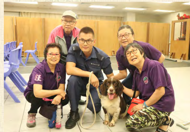
會員與警隊緝毒警犬的明日之星史賓格犬合照。