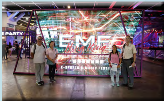
耆樂警訊會員於香港電競音樂節特色背景合照。