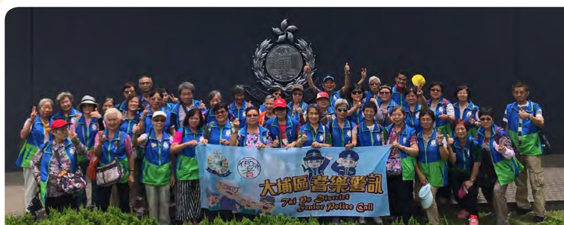
會員於警犬訓練基地外合照。