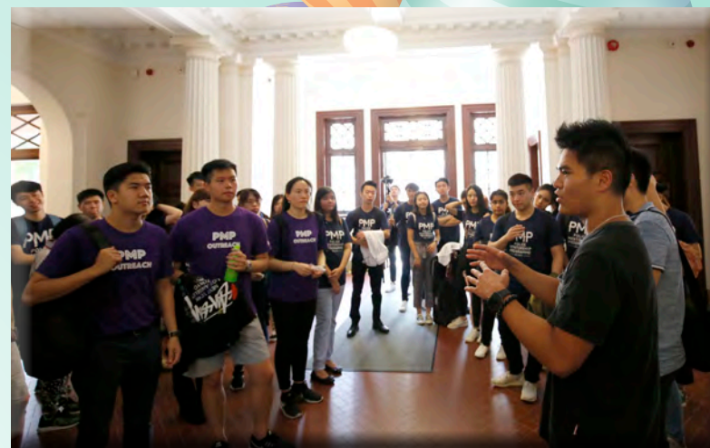
耆樂警訊及長者聯絡組人員與學員分享工作經驗。

除了觀賞展覽之外，帶領參觀的耆樂警訊及長者聯絡組人員藉此機會與學員分享警務工作的經驗，並鼓勵他們及早裝備自己，提升自信以應對日後的挑戰。