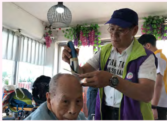
耆樂警訊會員為長者剪髮並向他們表示關愛。