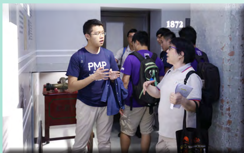
耆樂警訊導賞員向「警隊學長計劃」學員介紹展品。