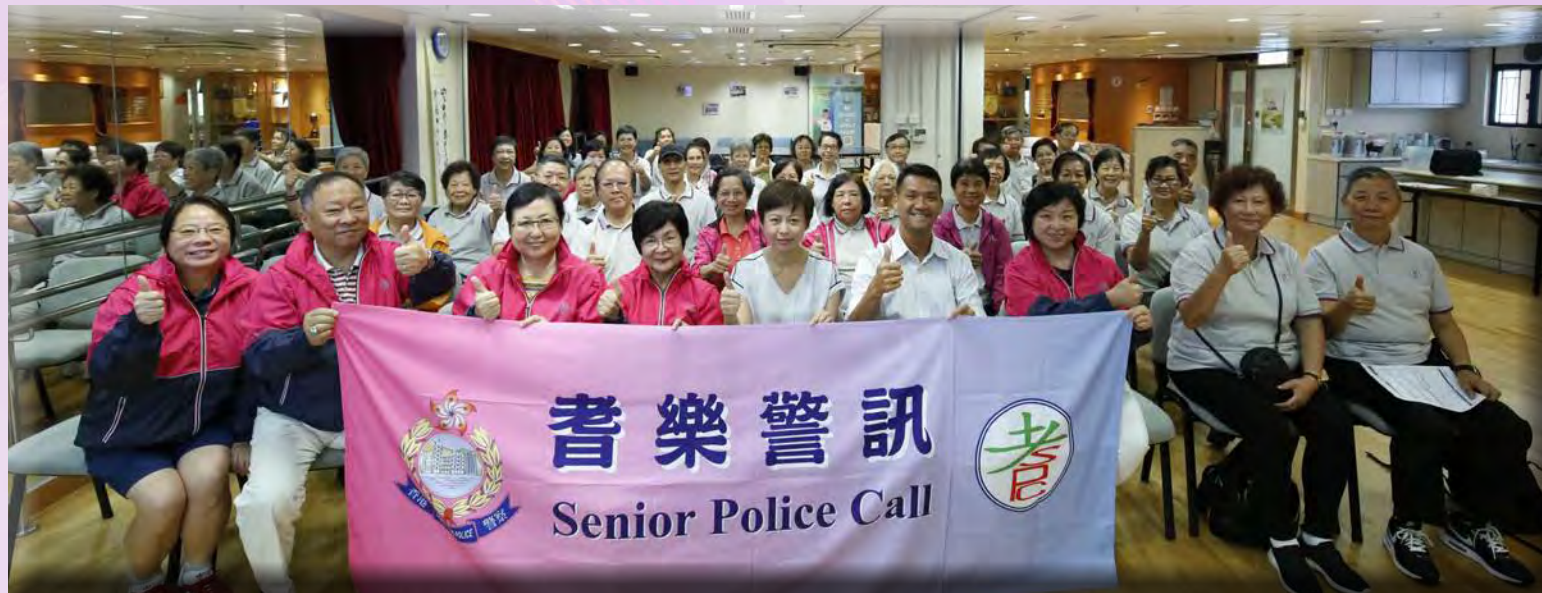
新一批「耆樂理財防騙長門人」於首日課程大合照。

耆樂警訊於 2019 年再次聯同商業罪案調查科、防止罪案科及投資者及理財教育委員會舉辦第五輪「耆樂理財防騙長門人」課程。旨在透過課程提高長者社群的防罪意識及正確的理財概念。成功通過考核的畢業學員將會成為新一批「耆樂理財防騙長門人」，於警區中向其他長者分享理財和防騙信息。