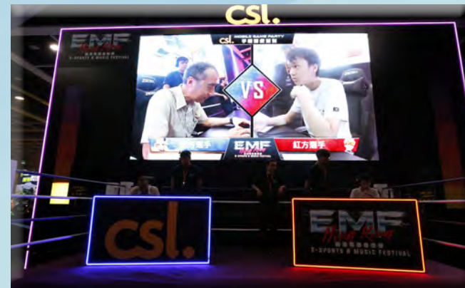
老友記與年青人切磋賽車手機遊戲。