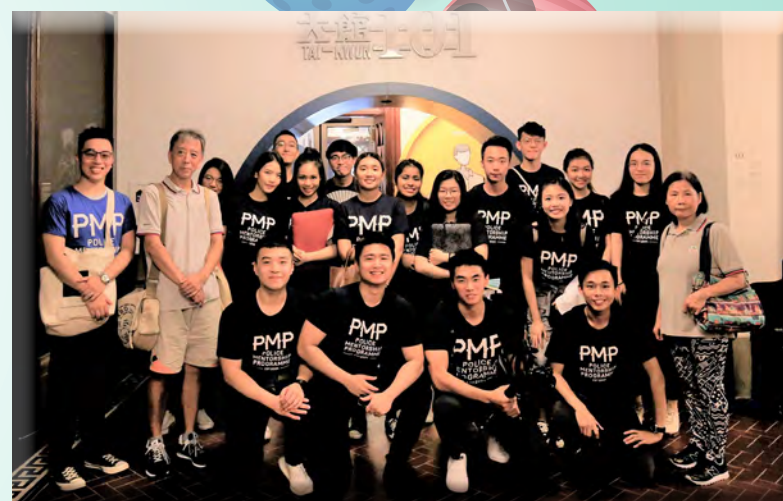
耆樂警訊導賞員向「警隊學長計劃」學員介紹「101」專題展覽。