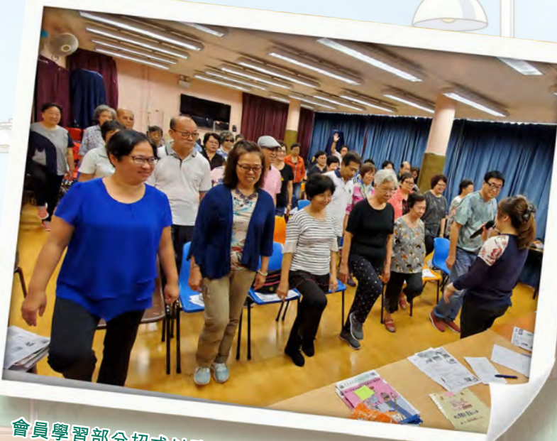
會員學習部分招式以改善平衡力。

有見及此，九龍城區耆樂警訊於 2019 年 5 月 30 日的「耆樂隊長會」中，邀請到九龍醫院職業治療師曾姑娘，為會員舉辦「預防跌倒」講座。曾姑娘詳細講解了引致跌倒的原因或風險，例如視力不佳、關節及步姿問題、疾病或藥物影響等。亦提供了一些防跌小貼士，例如保持通道暢通、確保地面乾爽及平坦、選擇合適的家具以及有充足照明。個人方面則要注意衣物鞋履是否稱身。而行動不便的人，更要善用輔助器具，如拐杖或助行架等。最重要是有健康的生活模式 - 均衡飲食、避免煙酒、多做運動、妥善控制長期病患。曾姑娘更親自示範並教授八段錦健身氣功，除強身健體外，亦令關節較為柔韌，當中部分招式亦能改善長者平衡力，減低跌倒風險。