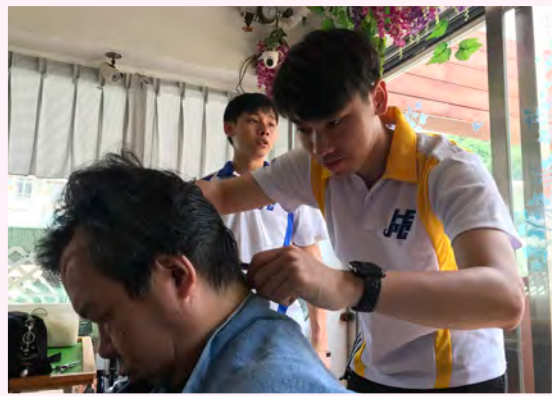
東區少年警訊會員的剪髮技巧純熟。