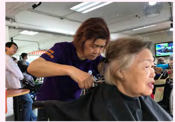
耆樂警訊會員認真為長者剪髮。