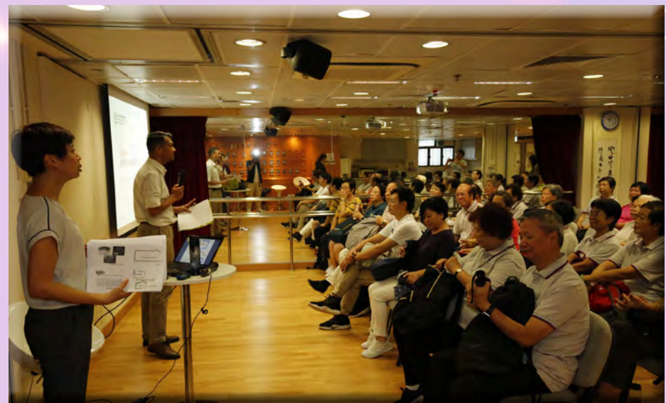
耆樂警訊及長者聯絡組人員向會員介紹課程內容。

會員表示課程內容對他們有益，尤其在長者個人理財計劃安排給予更清晰的指引，而且亦讓他們增加提防投資騙案的意識。會員需要了解課程內容及能夠有條理地表達課程內容向其他長者分享。他們並將會於 10 月 11 日最後課堂接受相關演講考核。期望會員能順利通過考核晉升成為實至名歸的「耆樂理財防騙長門人」，將課程掌握到的理財防騙知識學以致用，於不同場合下協助警方傳遞審慎理財和防騙信息，減少長者受騙的機會。