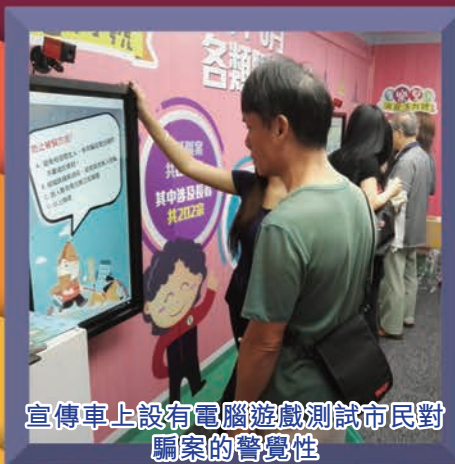
宣傳車上設有電腦遊戲測試市民對騙案的警覺性