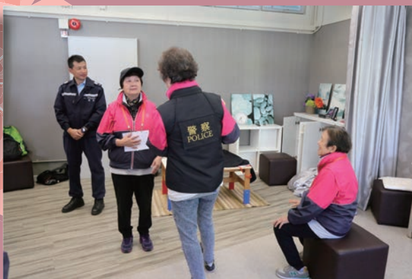
耆樂隊長於模擬罪案現場了解調查工作