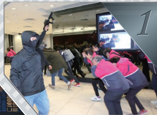
1 會員投入演習模式