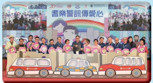
主禮嘉賓主持啟動儀式