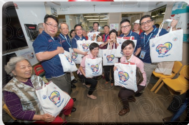
警察公共關係科與耆樂警訊中央諮詢委員會委員於長者中心派發福袋