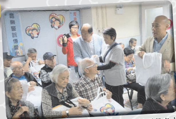
東區耆樂警訊會名譽會長會主席及會長到長者中心派發福袋