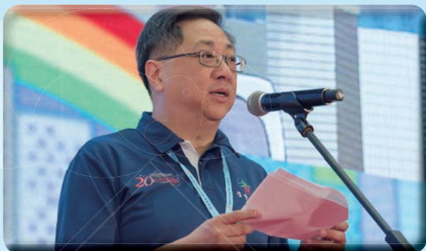
處長鼓勵耆樂警訊會員善用他們的經驗，發揮所長，與警方攜手滅罪，打擊罪案，服務社會