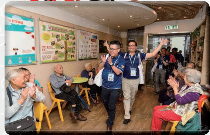
耆樂警訊中央諮詢委員會委員在長者中心獲得老友記熱烈歡迎