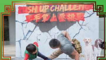
孩童與成人一同回應單手掌上壓挑戰