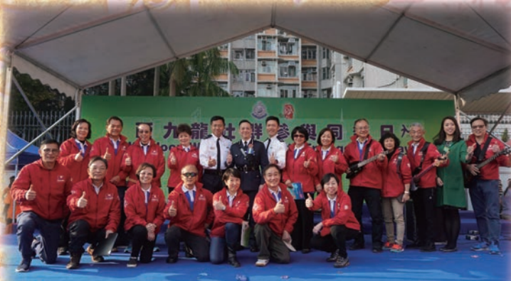
耆樂警訊 Band 隊的出色表現獲警官讚許