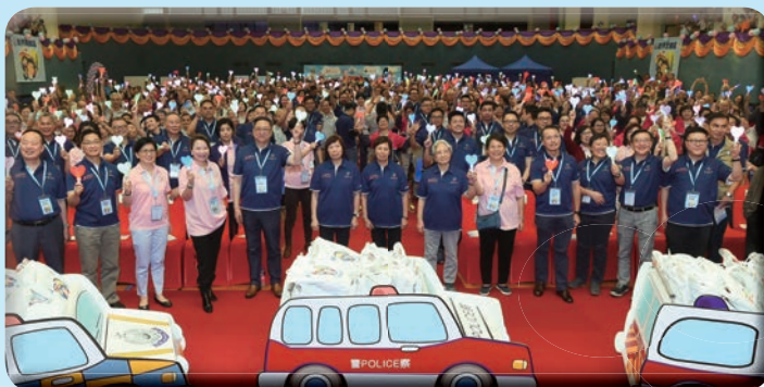
處長與一眾嘉賓及耆樂警訊會員合照