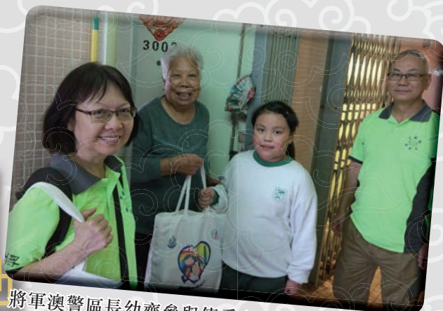
將軍澳警區長幼齊參與傳愛心活動