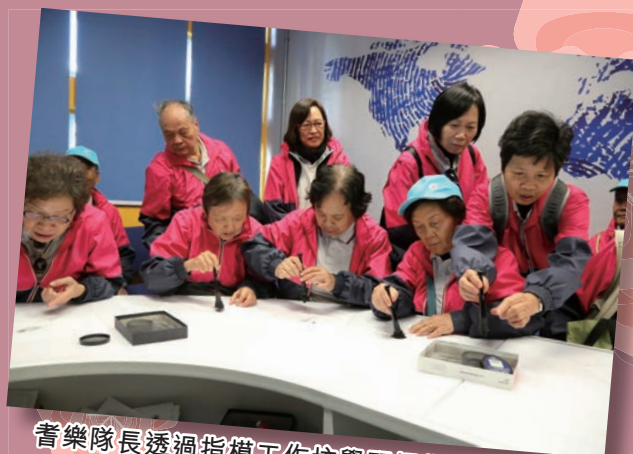
耆樂隊長透過指模工作坊學習掃指模的技巧