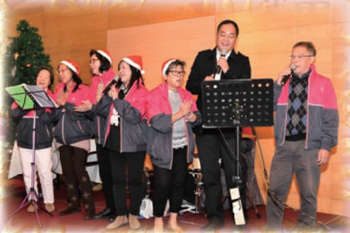
多才多藝的耆樂警訊會員音樂表演

當日活動除了有一眾多才多藝的老友記載歌載舞外，尚有抽獎環節，耆樂會員人人有獎，高漲氣氛讓每位老友記都能享受愉快聖誕歡聚。席間大嶼山區耆樂警訊名譽會長會副主席鮑誠業先生，感謝即將調任沙田警區的警區指揮官麥劉慧敏高級警司，一直對耆樂警訊的大力支持，代表一眾耆樂老友記祝願麥劉慧敏高級警司在新環境工作順利。麥劉慧敏高級警司則上台獻唱回謝各老友記一直對大嶼山警區的支持及努力付出，讓耆樂會員們渡過難忘聖誕。