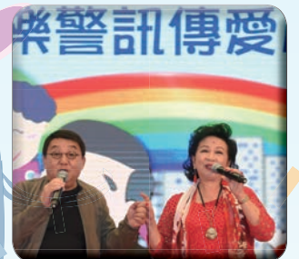
大會音樂總監黎小田及關愛大使薛家燕合唱經典金曲