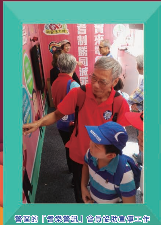
警區的「耆樂警訊」會員協助宣傳工作