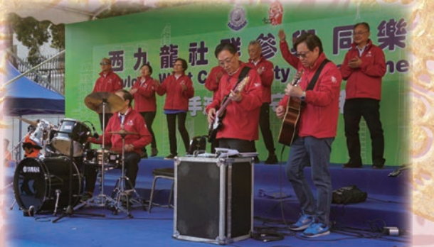
油尖警區耆樂警訊 Band 隊為同樂日增添歡樂的氣氛

油尖警區耆樂警訊 Band 隊於2017年12月10日參與「西九龍社群參與同樂日」活動，以協助宣傳防罪信息及加強不同社群與警隊的聯繫，而14名隊員更合作表演兩首名曲，透過是次演出，讓隊員可以發揮過去練習的成果和充分展現合作精神，亦為同樂日增添歡樂的氣氛。