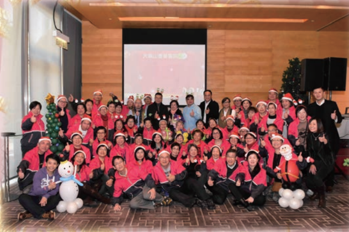
耆樂警訊會員在普天同慶聖誕聯歡會聚首一堂