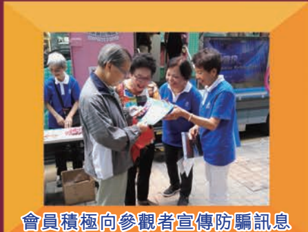
會員積極向參觀者宣傳防騙訊息

宣傳車設計精美，車身及車廂張貼了防騙及和諧家庭資訊供市民參觀，亦有播放「關愛大使」薛家燕、「減罪大使」胡楓和「防罪大使」區瑞強等為「耆樂警訊」拍攝的宣傳短片，吸引了不少市民駐足觀看。另外，車上亦有電腦遊戲及 VR 體驗鏡供市民透過遊戲體驗，向參觀者灌輸相關主題的正確訊息。市民亦可在完成遊戲後拍攝合成相片，將相關訊息帶回家與家人分享。