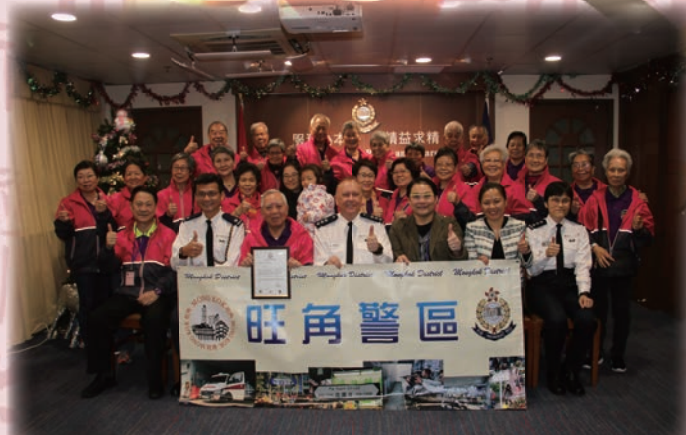
超過30名耆樂警訊會員到場支持嘉許禮