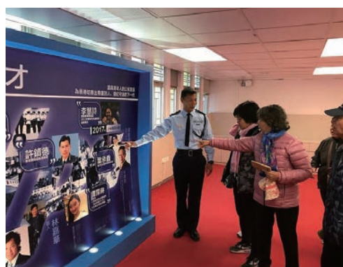
老友記參觀中心的展覽室