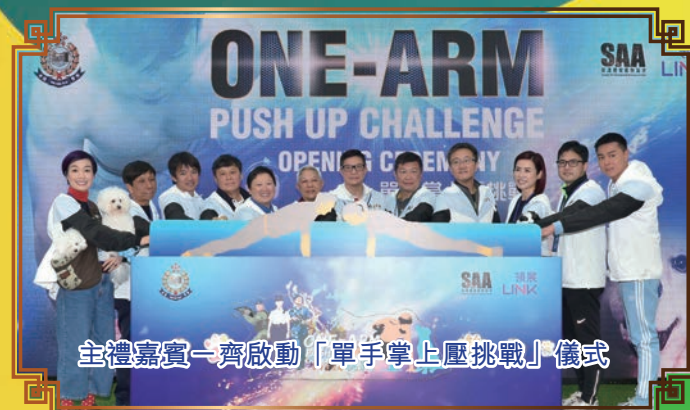
主禮嘉賓一齊啟動「單手掌上壓挑戰」儀式