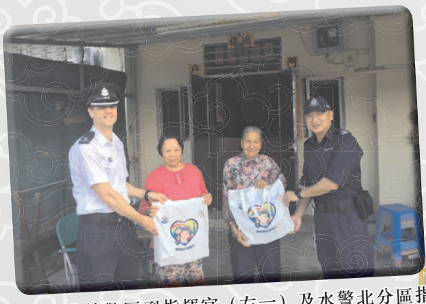
水警港外警區副指揮官（左一）及水警北分區指揮官（右一）親自上門探訪有需要長者