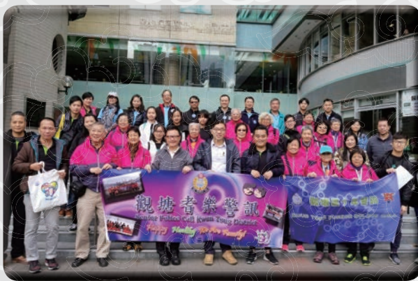
觀塘警區人員浩浩蕩蕩前往長者中心探訪