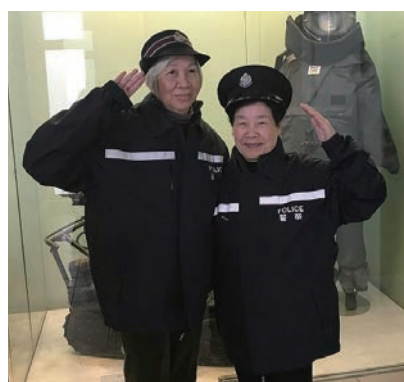
老友記試穿整齊的警察制服頓感威風十足