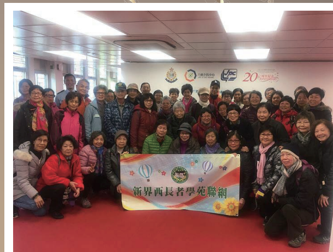
新界西長者學苑聯網老友記首次參觀八鄉少訊中心

警察公共關係科耆樂警訊邀請新界西長者學苑於 2017 年 12 月 20 日參觀八鄉少年警訊永久活動中心，約有 50 位長者參與。參觀當日行程緊湊、內容豐富，除了參觀展覽館、高空吊索、音樂廣場和人造草地足球場等戶外設施外，老友記更有機會參觀模擬罪案現場、記者室、指紋鑑證工作坊和試穿警察制服，過程不但新奇好玩亦令老友記大開眼界，同時加深了他們對警務工作的親身體驗和認識。體力充沛的老友記其後更試玩了飛標足球和地壺球。為表示對警方是日悉心安排參觀活動的謝意，一眾長者亦獻上才藝表演，包括魔術、粵曲演唱和聖誕組曲，為八鄉少訊中心帶來聖誕前夕的歡樂氣氛。