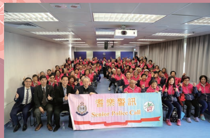
耆樂警訊中央諮詢委員會委員出席委任儀式後與耆樂隊長合照

是次訓練課程由八鄉少訊中心為「耆樂隊長」度身制訂。中心人員除了帶領「耆樂隊長」參觀八鄉少訊中心的各項訓練設施，亦透過中心的訓練設施加強「耆樂隊長」學習溝通技巧、團隊合作精神及發揮領導才能。「耆樂隊長」當日接受了嶄新的遊戲「地壺球」訓練，亦參與中心獨有的指模工作坊、罪案現場角色扮演以加深對警務工作的認識。最後中心人員向「耆樂隊長」講解最新的罪案趨勢及防騙資訊，並以互動問答形式鞏固他們的防罪知識。