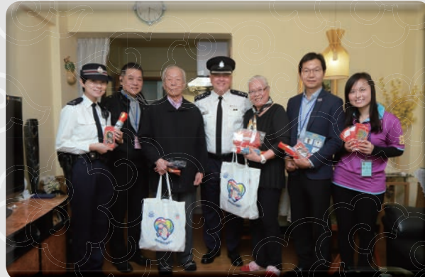
旺角警區人員與耆樂警訊名譽會長派發福袋