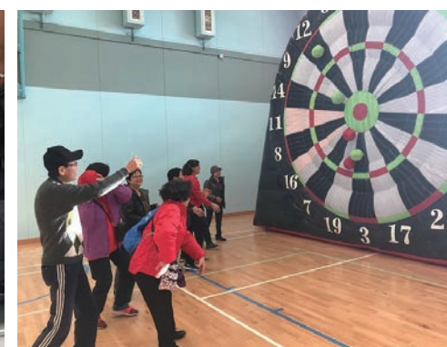
體力充沛的老友記試玩飛標足球