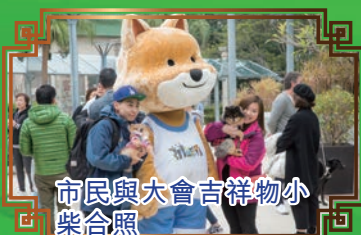
市民與大會吉祥物小柴合照