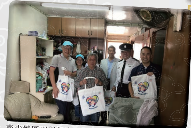
葵青警區副指揮官（署理）上門探訪獨居長者