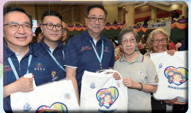
處長與委員於現場派發福袋