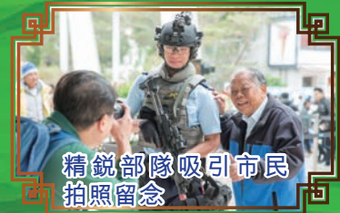
精銳部隊吸引市民拍照留念