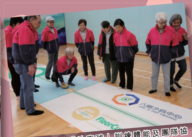
嶄新的遊戲「地壺球」訓練體能及團隊協作能力