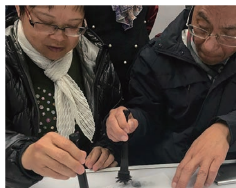
老友記在指紋工作坊學習掃指紋