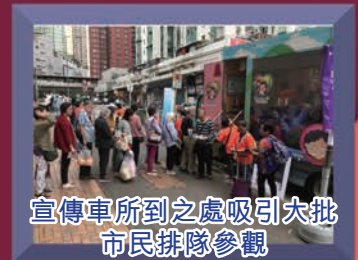
宣傳車所到之處吸引大批市民排隊參觀