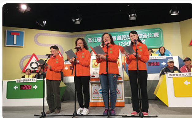
大會安排「老友記」獻唱活動主題曲： 《做個精叻過路人》