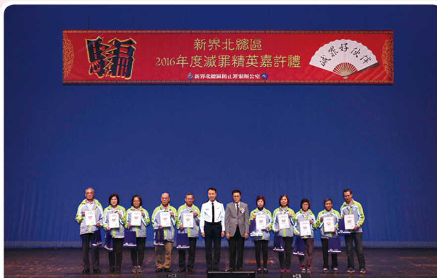
主禮嘉賓頒發嘉許狀予「減罪精英大使」，以表揚其積極協助警方防罪減罪工作