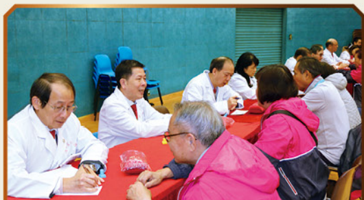
各中醫師專業地為「耆樂警訊」會員提供適切的醫療諮詢服務，惠澤長者