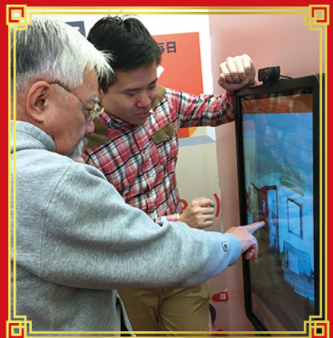
透過嶄新的觸屏（左）及VR虛擬實景（右）技術融入遊戲當中，成功及有效將防罪訊息傳遞至社區每一角落