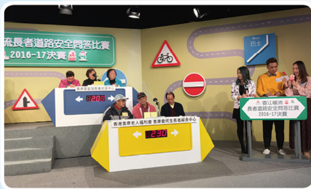
搶答環節時各組均施展渾身解數，氣氛緊張刺激