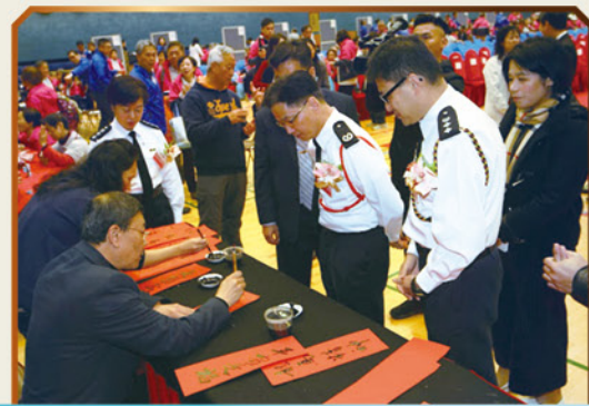
警察書畫學會代表為嘉賓及「耆樂警訊」會員送上賀年揮春

擁有健康人生，才能活得豐盛。為了提升「耆樂警訊」會員對防罪和保健的認識，警察公共關係科首度與「南方醫科大學香港校友會」合作，為 20 區的「耆樂警訊」會員提供免費中醫諮詢服務及防罪講座。整個計劃更預計有數千名會員受惠。