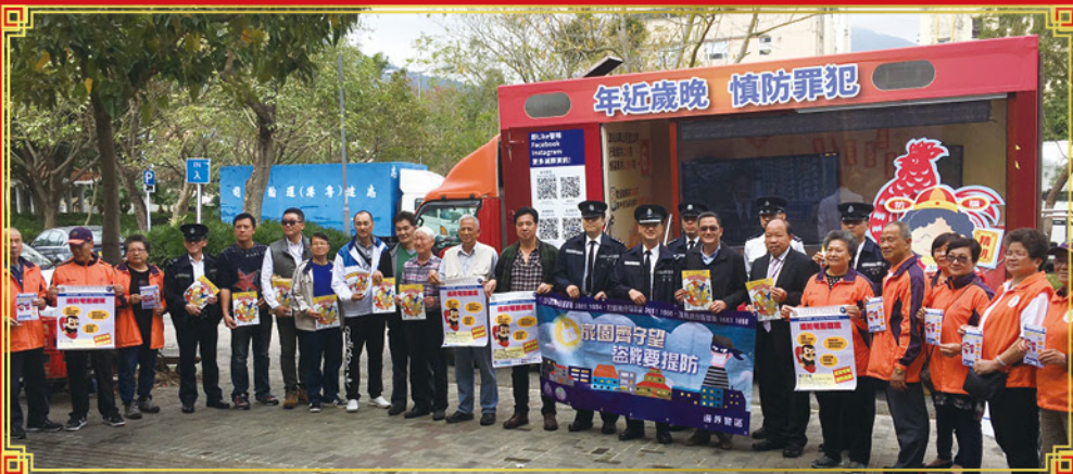
警民一家，攜手撲滅罪行