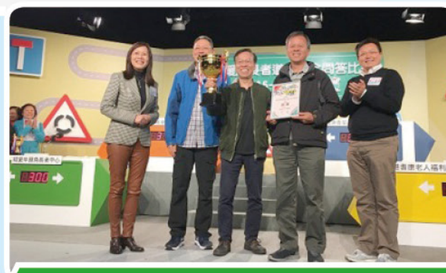
經過一番龍爭虎鬥，「神託會香港退休男士服務隊」隊脫穎而出，勇奪冠軍