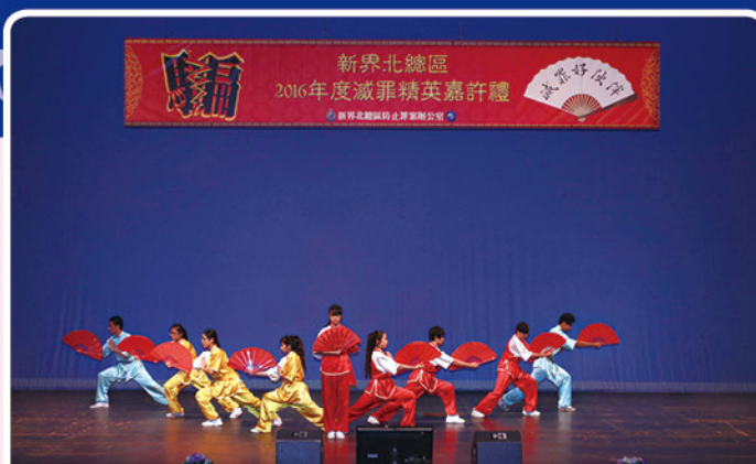
新界北少年警訊會員在嘉許禮上表演「扇舞」，表現令全場掌聲雷動

典禮中有六十一名於過去一年有積極表現的「減罪精英大使」獲嘉許。總區亦表揚曾協助防止電話騙案的銀行職員、匯款公司職員和市民，以及協助宣傳防騙訊息的中小型企業，以鼓勵業界伙伴和市民與警方建立更緊密合作關係。典禮後由義工向長者派發福袋。