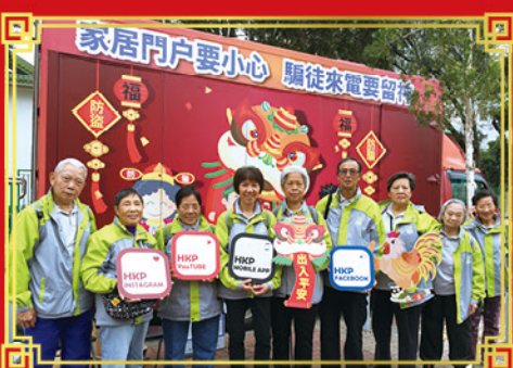
「滅罪活力號」宣傳車活動走訪各警區，期間有賴會員積極參與，盡顯「老有所為」