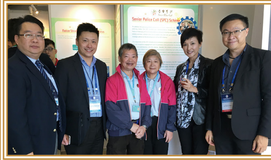
各嘉賓表示對於長者積極參予「耆樂警訊」計劃感到鼓舞

研討會期間，「少年警訊」及「耆樂警訊」亦各派出兩位代表向出席嘉賓及學者介紹「少年警訊」及「耆樂警訊」的成立和發展概況，以加深社區人士對計劃的了解。