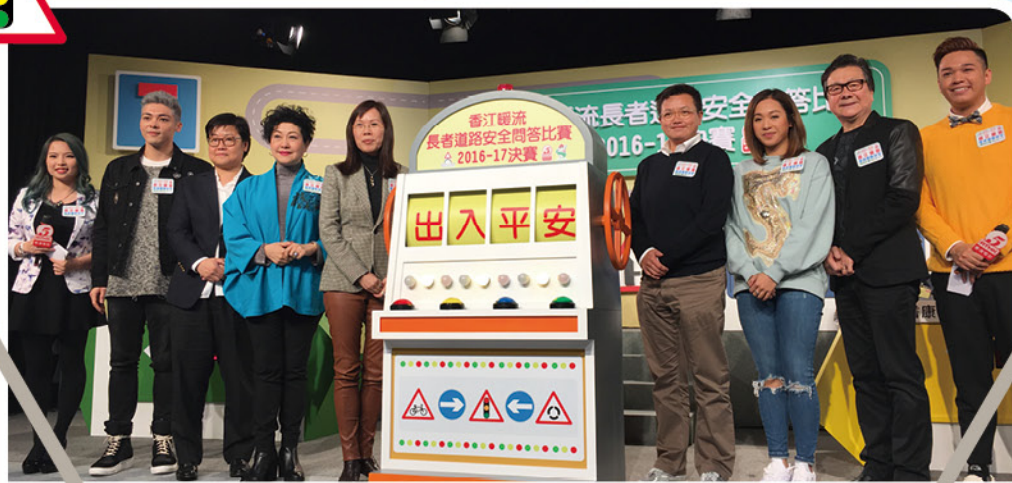
主禮嘉賓主持啟動儀式