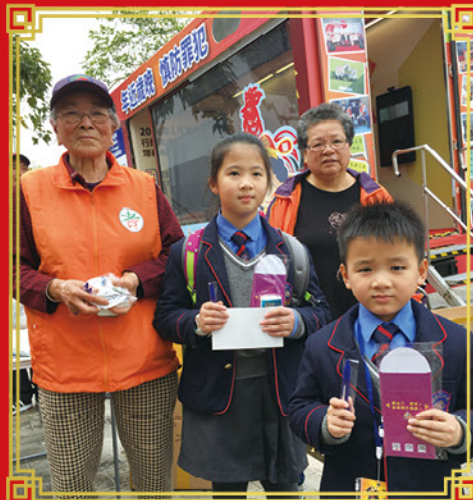
「長幼共融」，共建和諧社區