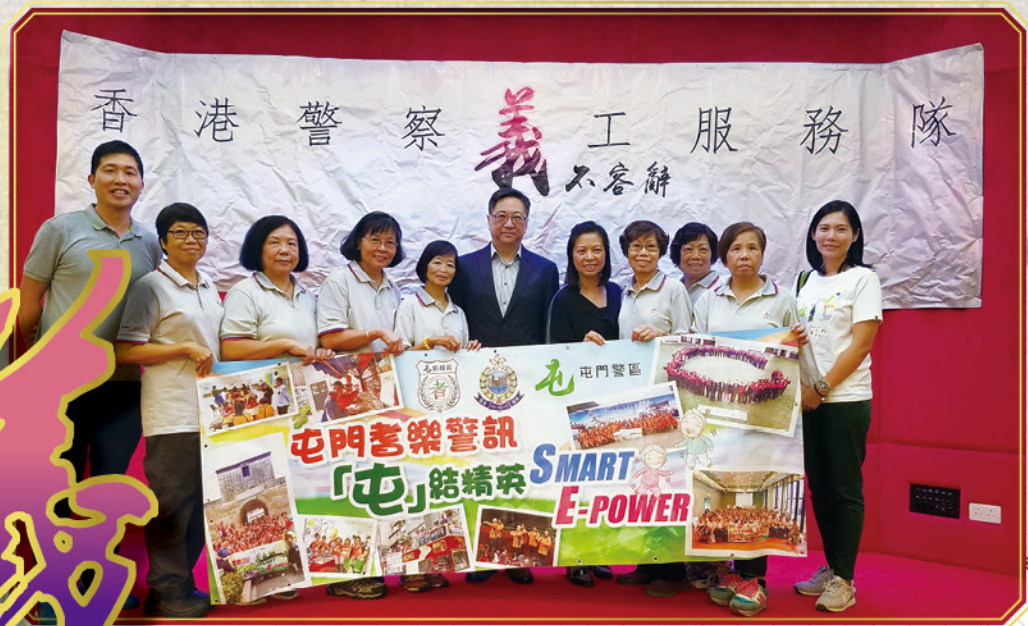
警務處處長盧偉聰先生表揚「耆樂警訊」會員熱心參與義務工作，貢獻社會

屯門區耆樂警訊「屯」結精英成立至今一向熱心社區義工服務，由屯門警區警民關係組安排參與區內義務工作，包括派發減罪傳單、探訪長者中心提醒長者注意道路安全及提防受騙，更在區內多間小學及社區活動中推廣『功夫減罪操』。同時製作防止罪案宣傳短片並上載警察網頁及在屯門區大型商場播放，以提高市民的防罪意識。去年「屯」結精英會員提供無私的服務，總義工時數超過 1000 小時，獲得社會福利署服務金獎。