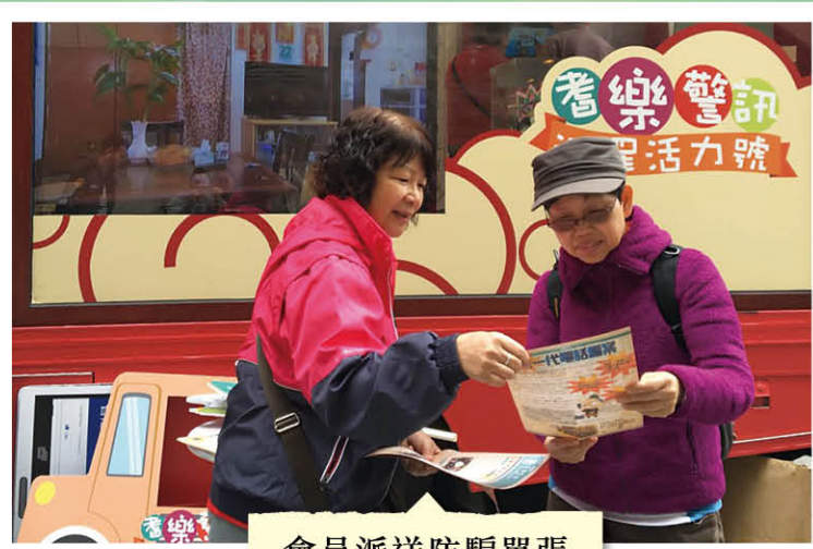
會員派送防騙單張

「滅罪活力號」開步禮於 2015 年 11 月 24 日啟動後，已完成了分別以「長者道路安全」、「冬季防罪錦囊」(簡稱「冬防」)及「防止騙案」為主題的旅程，走訪全港各區，向廣大市民特別是長者，推廣道路安全及宣揚滅罪的訊息。色彩繽紛的「耆樂警訊滅罪活力號」所到達的每一個地方都會吸引途人圍觀。無論長者或小朋友都會駐足觀看車上短片、親身參與車內的互動電腦遊戲及拿起精美的道具拍照留念。另一邊廂，充滿活力的耆樂警訊會員則忙於接待來賓，傳遞道路安全及滅罪訊息，並宣傳耆樂警訊計劃，務求令到每一名到訪者都可以滿載而歸。