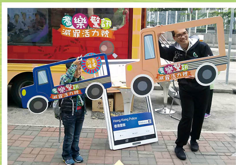
可愛的迷你版「滅罪活力號」供市民攝影留念