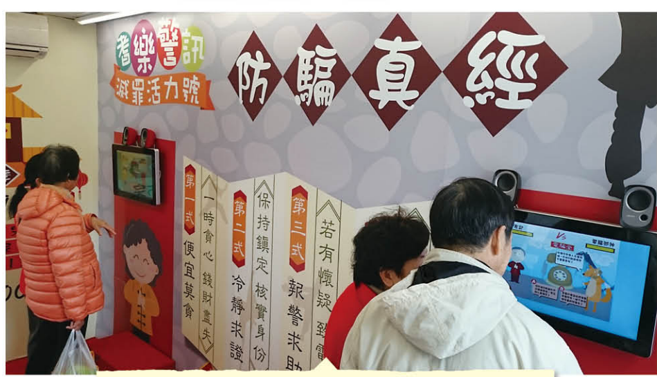
「滅罪活力號」上設有特別設計的電腦遊戲