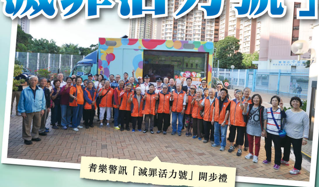
耆樂警訊「滅罪活力號」開步禮

耆樂警訊於 2015 年 11 月至 2016 年 2 月推出「滅罪活力號」宣傳車，是一個為期 4 個月的大型宣傳活動，宣傳車每個月均會在不同的時段以不同的面貌和主題到各警區作道路安全及防罪宣傳。車上更設有電腦遊戲、資訊站以增加市民對該主題的認識。