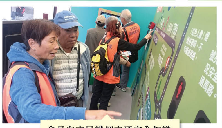
會員向市民講解交通安全知識

「滅罪活力號」開步禮於 2015 年 11 月 24 日啟動後，已完成了分別以「長者道路安全」、「冬季防罪錦囊」(簡稱「冬防」)及「防止騙案」為主題的旅程，走訪全港各區，向廣大市民特別是長者，推廣道路安全及宣揚滅罪的訊息。色彩繽紛的「耆樂警訊滅罪活力號」所到達的每一個地方都會吸引途人圍觀。無論長者或小朋友都會駐足觀看車上短片、親身參與車內的互動電腦遊戲及拿起精美的道具拍照留念。另一邊廂，充滿活力的耆樂警訊會員則忙於接待來賓，傳遞道路安全及滅罪訊息，並宣傳耆樂警訊計劃，務求令到每一名到訪者都可以滿載而歸。