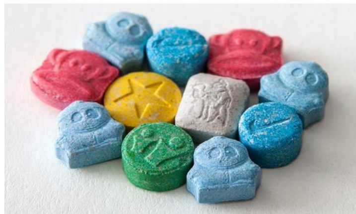
摇头丸通常以五颜六色的药丸出现， 药丸印有奇怪的图案