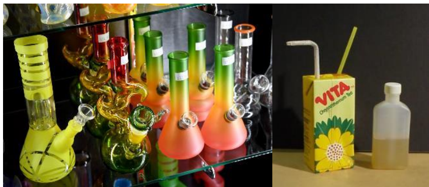
水烟筒状的容器是常见吸毒工具