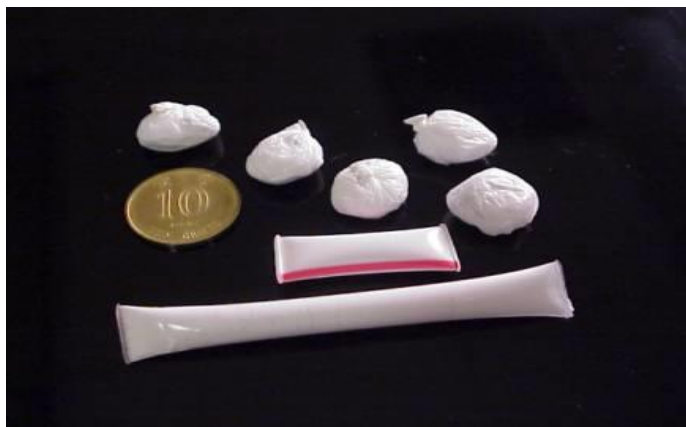
海洛英常见的包装