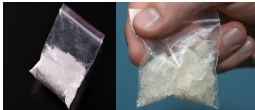
密封胶袋包着粉状/晶状物体