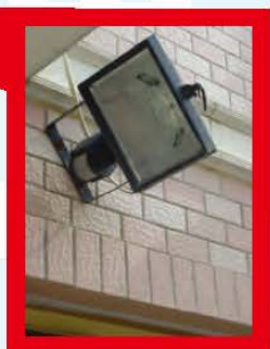
具有動作偵測功能的照明系統