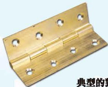
典型的對槽式門鉸

門鉸數量視乎門的尺寸和重量而定。理想地說，門與門框之間最少應由三個銅、黃銅或青銅製的門鉸連接，而門鉸之間的距離亦須平均。