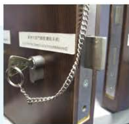
以鑰匙操作的梗鎖