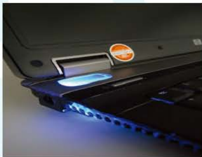
在紫外光下的保安標記

考慮使用永久蝕刻、隱形紫外光墨水或其他方法，在貴重財物上刻上保安標記。你也可以用自己的香港身份證號碼識別屬於自己的物件。