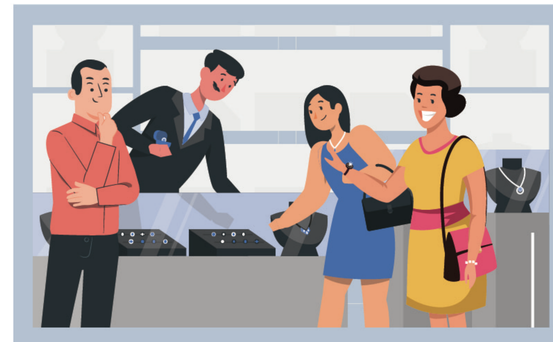
人手不足/太多顧客